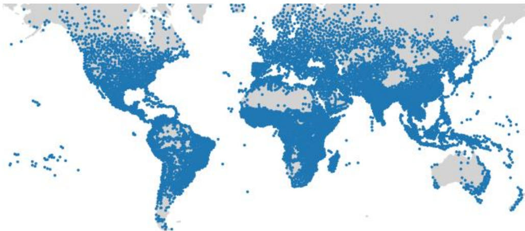
Figure 3. Centroïdes du fret domestique

Les centroïdes du fret domestique définissent les origines et les destinations des flux de fret domestique. Ces centroïdes sont estimés par un algorithme de couverture d'ensemble similaire à celui décrit ci-dessus. Il utilise des données matricielles sur le PIB pour identifier la cellule matricielle la plus représentative dans un rayon de 100 km. Le modèle produit un total de 7303 centroïdes domestiques. Comme pour les centroïdes de fret international, la zone d'influence de chaque centroïde de fret national est calculée sur la base d'une carte matricielle de la surface du globe. Les estimations de population et de PIB sont liées à chaque centroïde tout en respectant les frontières des pays. Pour ce faire, chaque cellule matricielle est assignée à un centroïde situé dans le même pays que la cellule matricielle, en fonction de sa distance au centroïde. Figure 3 donne un aperçu des centroïdes de fret domestique qui ont été définis dans le modèle de fret de l'ITF.