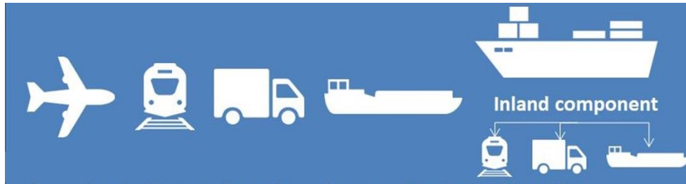
Figure 4. Modes de transport distingués par le modèle

Le modèle utilise une formulation logit multinomiale imbriquée, comprenant un terme de panel de type de marchandise temporelle et un terme de panel de type de coût de fret. La formulation mathématique est la suivante :